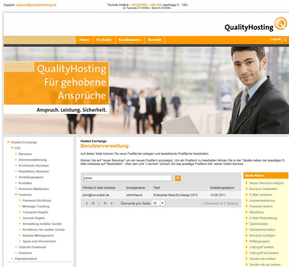
Abbildung 1: Hosted Exchange Verwaltung